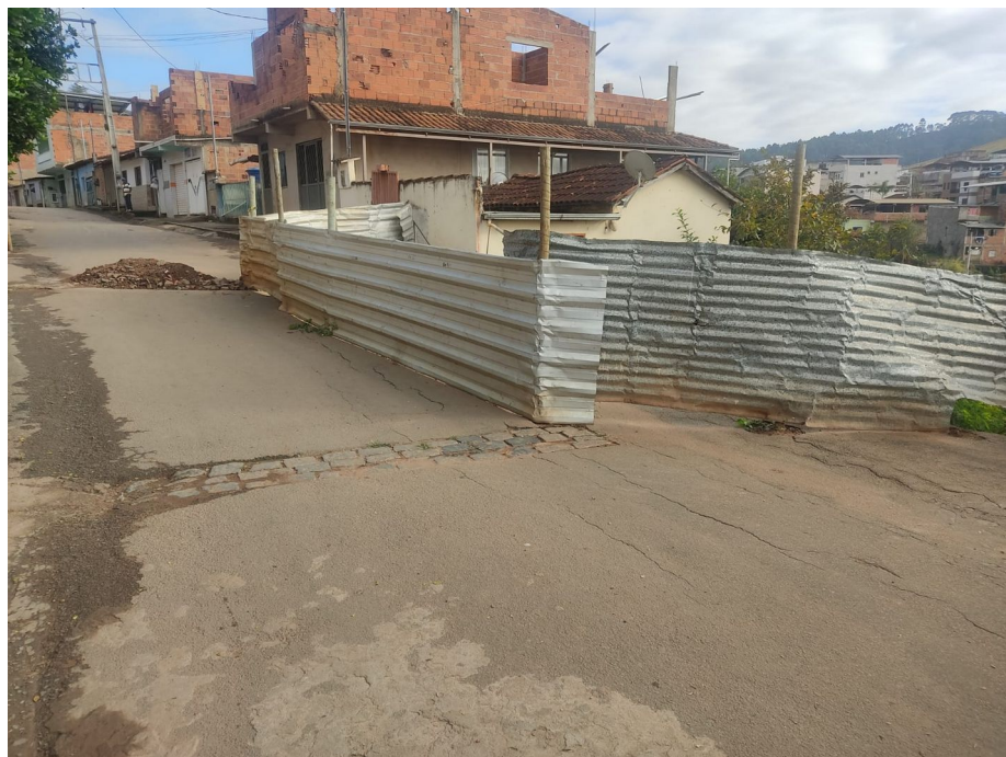
Legenda: Vista 2 – Rua Boa Vista