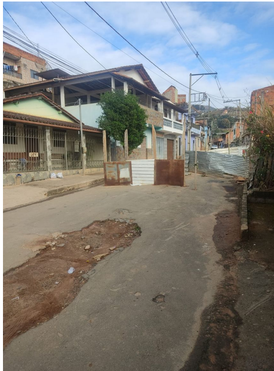
Legenda: Vista 1 – Rua Boa Vista