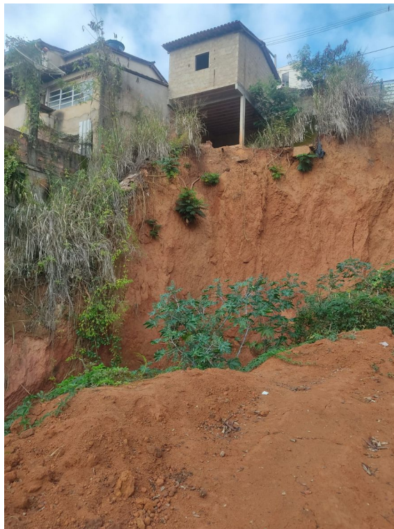
Legenda: Vista 2 – “Buracão”