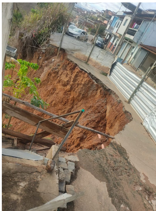
Legenda: Vista 4 – Rua Boa Vista