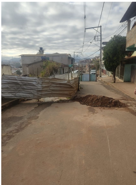
Legenda: Vista 3 – Rua Boa Vista